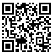
Odstavná plocha VT Jince